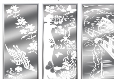
Пятая категория сложности

3000 руб./кв.м. 3500 руб./кв.м. 3800 руб./кв.м.