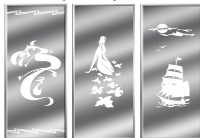
Четвертая категория сложности

2000 руб./кв.м. 2500 руб./кв.м. 2900 руб./кв.м.